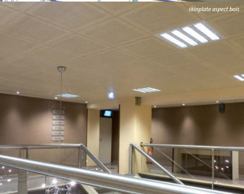
skinplate aspect bois