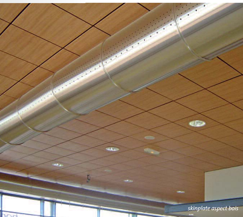
skinplate aspect bois