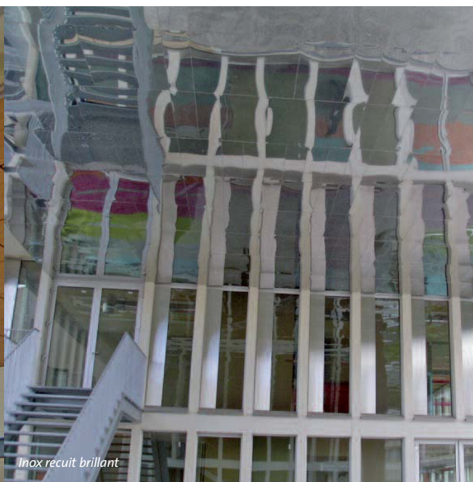
Inox recuit brillant